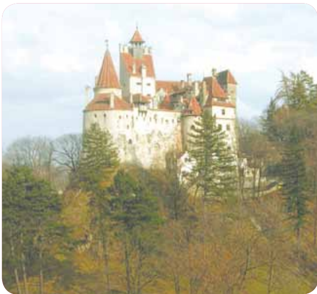
Castillo de Vlad III - en Transilvania