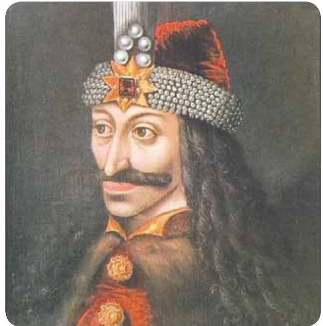
Vlad III - príncipe de Valaquia, conocido como 'Conde Drácula'